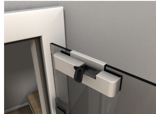
Aluminiumfarben | Glasanbindung