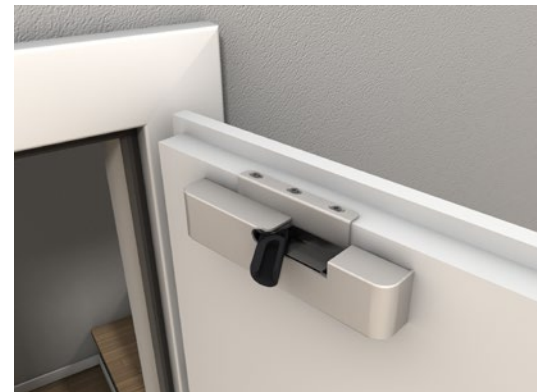
Edelstahl-Optik | Holzanbindung