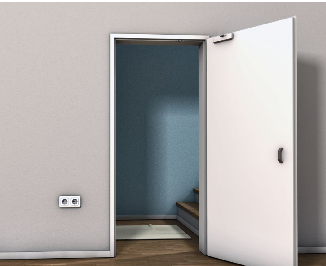
DrehMoment | Holzanbindung